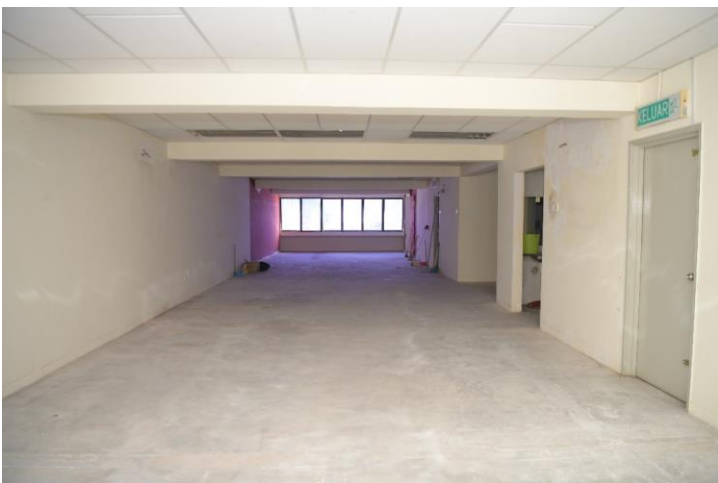
Pemandangan dalam lot kedai