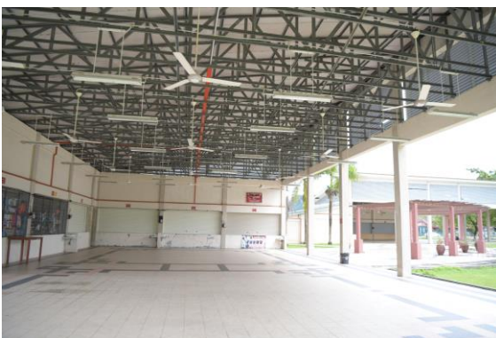
Pemandangan sekitar gerai