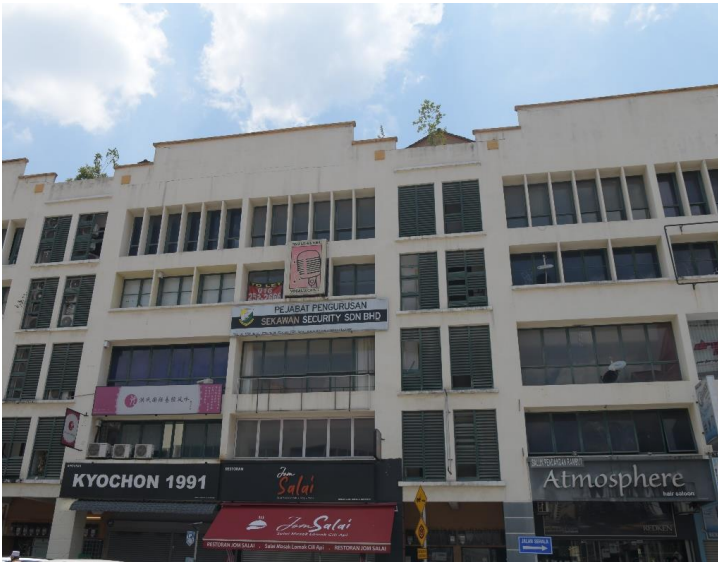
Pemandangan luar premis