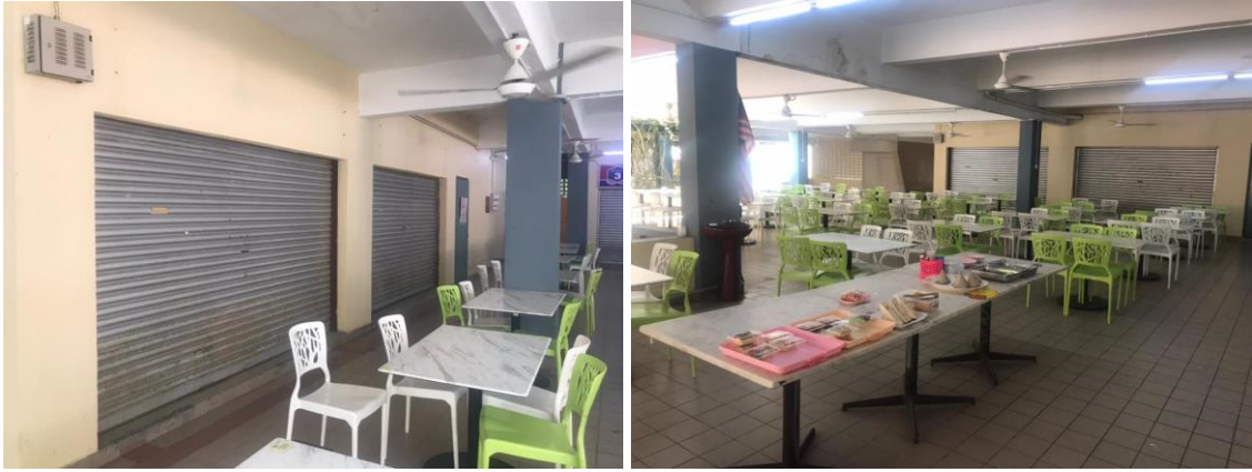
Pemandangan luar (sekitar medan selera)