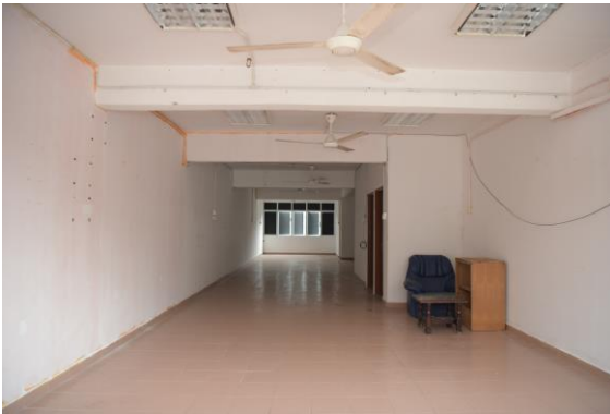
Pemandangan dalam lot kedai