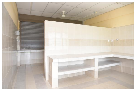
Pemandangan dalam gerai